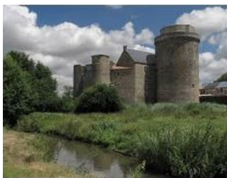
Château de St-Mesmin, St-André-sur-Sè...