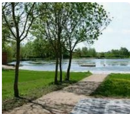
Base de loisirs des Adillons

A proximité la base de loisirs des Adillons , le château de Bournizeaux