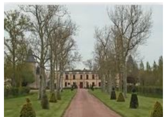
Château de Bournizeaux