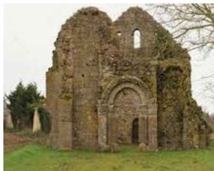
La chapelle St Guillaume